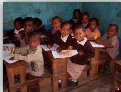
Baby-Class! So sweet!