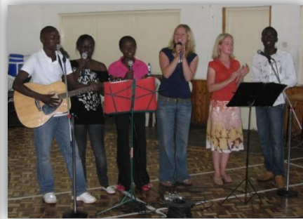
Worship-Team in de kerk (voor jeugdendienst)

In mijn nieuws-update van – volgens mij – februari vroeg ik gebed voor de