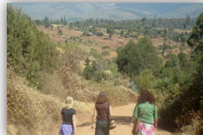
In de natuur...heerlijk- op weg naar de kerk.