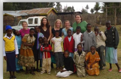
In Naivasha (Weeshuis)